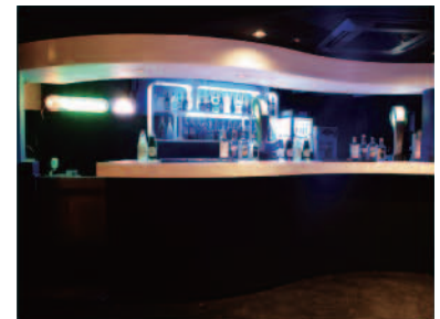
②BAR フロア最上段に位置するBARスペースは、常時 100種類以上のメニューを取り揃えております。