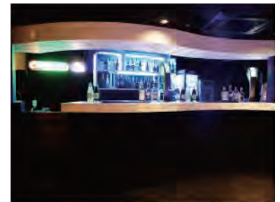
②BAR フロア最上段に位置するBARスペースは、常時 100種類以上のメニューを取り揃えております。