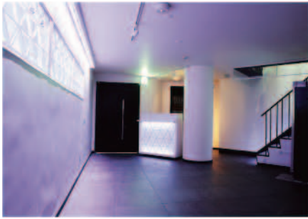
①2F LOUNGE スペースとして最適な空間。 壁面に設置されたLEDライトは、イベントに応じて様々な 顔色を演出します。

渋谷駅から徒歩7分。吹き抜けコロシウム状の店内は、客席のどの位置からでもステージが見やすい構造になっております。また、120インチのプロジェクターやDJ機材も常設しており、ワンマンライブは勿論の事、プレス発表や結婚式2次会等、幅広いイベントに対応できるスペースです。 着席スタイルでも70席まで対応可能な為、アコースティックライブ等にも適しています。