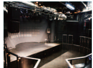
③STAGE メインフロアが扇形でコロシウム状になって いる性質上、後方のお客様もステージが見やすい のが特徴的です。