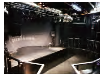
③STAGE メインフロアが扇形でコロシウム状になってい る性質上、後方のお客様もステージが見やすい のが特徴的です。