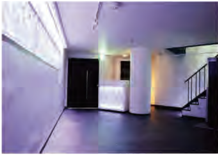
①2F LOUNGE スペースとして最適な空間。 壁面に設置されたLEDライトは、イベントに応じて様々な 顔色を演出します。

渋谷駅から徒歩7分。吹き抜けコロシウム状の店内は、客席のどの位置からでもステージが見やすい構造になっております。また、120インチのプロジェクターやDJ機材も常設しており、ワンマンライブは勿論の事、プレス発表や結婚式2次会等、幅広いイベントに対応できるスペースです。 着席スタイルでも70席まで対応可能な為、アコースティックライブ等にも適しています。