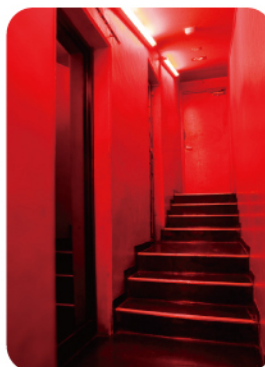
④MAIN FLOOR→2F 通路

赤に統一された通路は、いい意味での「クラブらしい怪しさ」を演出。会場内のアクセントになります。